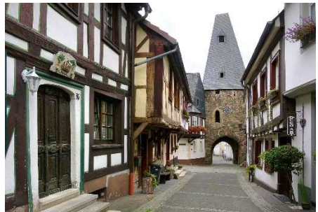
Ansichten von Herrstein im Hunsrück