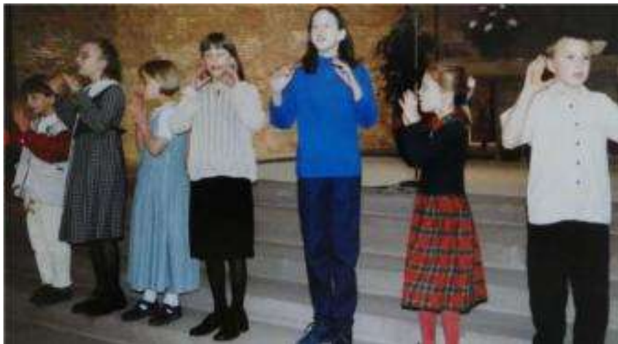
Sieben mutige Kinder haben am Palmsonntag 1999 erstmals im Gottesdienst in der Basilika gesungen.

In 20 Jahren haben fast 200 Kinder ab dem 1. Schuljahr, davon ein Drittel Jungen, im Chor gesungen.