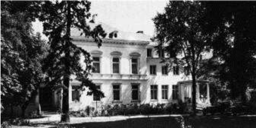
Das Parkhotel, Ende 1950er Jahre

Die evangelische Kirchengemeinde Trier existiert seit 1817. Anfänglich stand die Suche nach einem geeigneten Gotteshaus im Vordergrund. Erst 1856, als auf Befehl des preußischen Königs Friedrich Wilhelm IV. die Konstantin-Basilika wieder aufgebaut und der Kirchengemeinde zur ewigen Nutzung überlassen wurde, hatte die Gemeinde ein rituelles Zentrum gefunden.