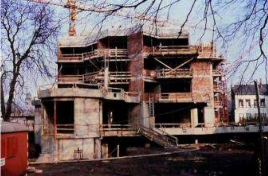
Rohbau Februar 1978, Photo: U.Hahn

u.a. dazu, dass der Gebäudekomplex vernachlässigt wurde. Durch den Standort am Rande des Maarviertels entwickelten sich zunehmend Feuchteschäden am Gebäude, bis das Presbyterium 1972 beschloss, das Gemeindehaus Nordallee abzureißen und etwas Neues zu bauen. Nach den Vorschlägen des eigens berufenen „Nordallee-Ausschusses“ plante das Architekturbüro Bodo Engel ein „Gemeindezentrum mit Altenwohnungen“. Die notwendigen Planungen und die Klärung der Finanzierungsfragen zogen sich hin bis zum Abriss des alten Gebäudes im Winter 1975/76.