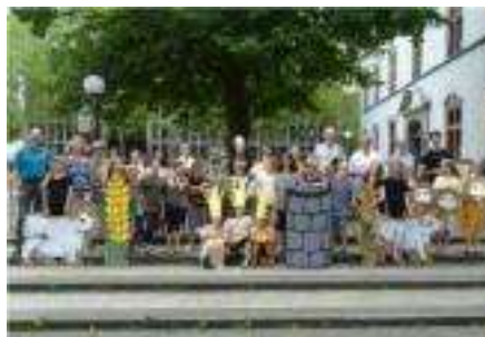
Josef und seine Brüder 2019