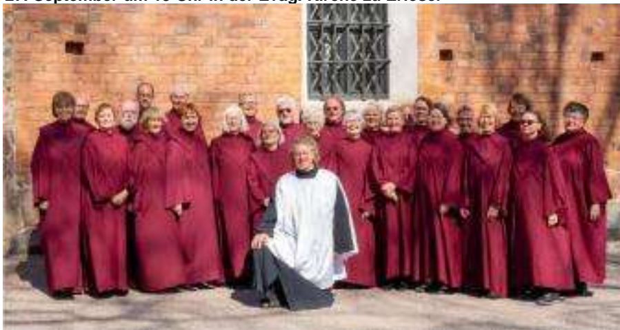
Der Helga Trefaldighets Motettkör