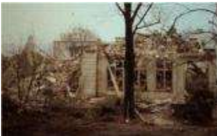
Abbruch Dezember 1975

anstaltungsräumen für eher „weltliche“ Aktivitäten der Gemeinde. Sie führte zur 1875 gebauten Villa Küchen in der Nordallee. Typisch für die Zeit hatte sich der Evangelische Bürgerverein e.V. gegründet mit dem Ziel, ein Vereinshaus „für allerlei evangelische Gemeinde- und Vereinsfeiern, Vorträge und außerkirchliche Versammlungen“ zu gründen. Die Villa konnte 1914 zunächst gemietet, teilweise umgebaut und dann gekauft werden. Das notwendige Kapital erwirtschaftete der Bürgerverein mit einer florierenden Weinhandlung. In den folgenden Jahren wurde das Haus mehrfach umgebaut und unterschiedlich genutzt, u.a. als evangelisches Gästehaus („Hospiz“ genannt). Die Nutzung einerseits als „Parkhotel“, andererseits durch Gemeinde- und Jugendgruppen war nicht konfliktfrei und führte