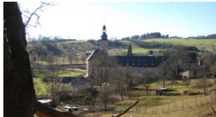
Das Karmeliterkloster Springiersbach