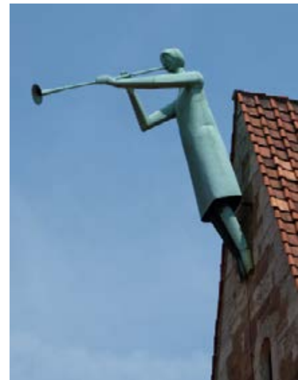
Posaunen sind schon immer etwas Besonderes: Foto: Dieter Schütz / pixelio.de

Am Sonntag mündet das Zusammentreffen der Bläserinnen und Bläser in einem großen abschließenden Festgottesdienst um 12 Uhr in der Kirche