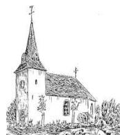
Ev. Kirche Andel

Evangelische Kirchengemeinde Mülheim (Mosel)