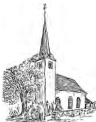
Ev. Kirche Mülheim (Mosel)